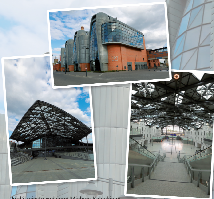
Łódź, miasto rodzinne Michała Kaleckiego, rok 2019.